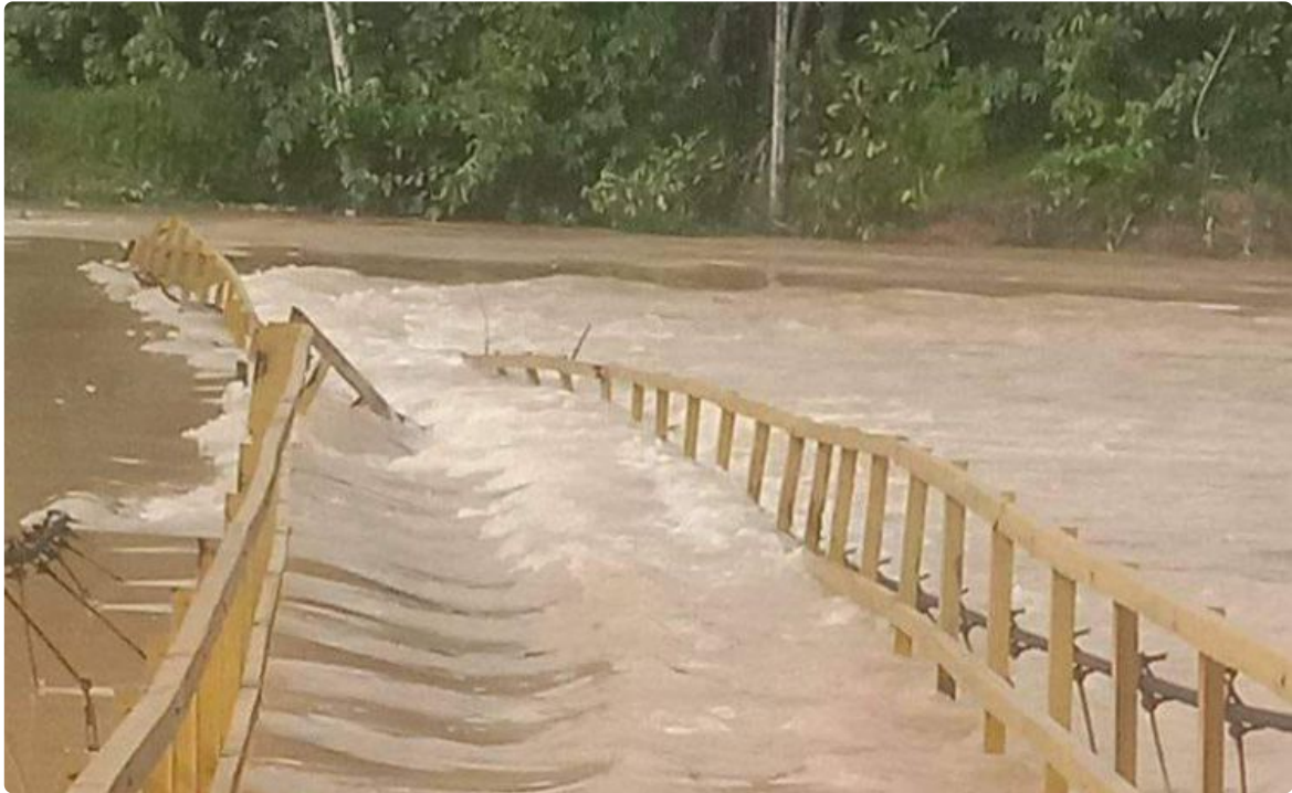
Poto Jembatan Yang Putus

Masyarakat Desa Pesajian dan sekitarnya sangat berharap jembatan yang terputus itu mendapat perhatian, ada perbaikan. Aspirasi itu, langsung direspon pihak Pemerintah Kabupaten Inhu dan PUPR Inhu.